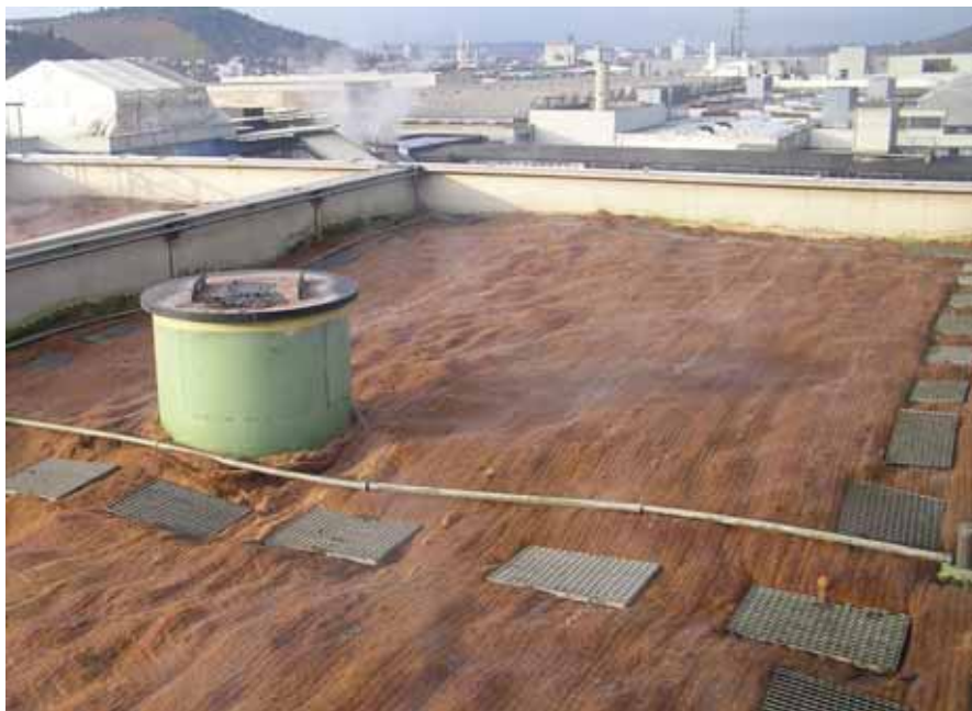
Biosuodatin Daimler Chrysler-tehtaassa Stuttgartissa. Valimon katolle sijoitetulla suodattimella puhdistetaan kaavaamosta vapautuvia muottien sideainekäryjä.

Hankkeessa on mukana kolme sellun valmistajaa Suomesta ja Italiasta, joiden tehtaissa AX-Suunnittelu mittaa VOC-päästöjä tämän vuoden aikana. Mittausten ja esiselvityksen perusteella rakennetaan kaksi koelaitosta. Hankkeessa testataan termiseen hapetukseen ja biosuodatukseen perustuvat järjestelmät. Kahta pääteknologiaa hankkeessa edustavat VOC-polttolaitosten suomalainen valmistaja